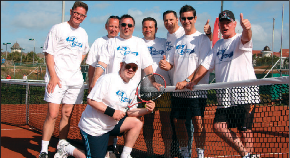
Freude I: Acht Tennisspieler des TSV Eintracht Immenbeck machten sich im Frühjahr ins türkische Antalya auf, um freiwillig ein einwöchiges Trainingslager zu absolvieren.