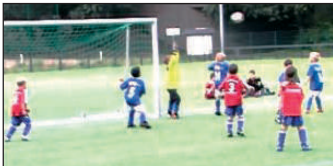
Die U7-Junioren des TSV Eintracht Immenbeck zeigten in der Rückrunde sehr gute Leistungen.