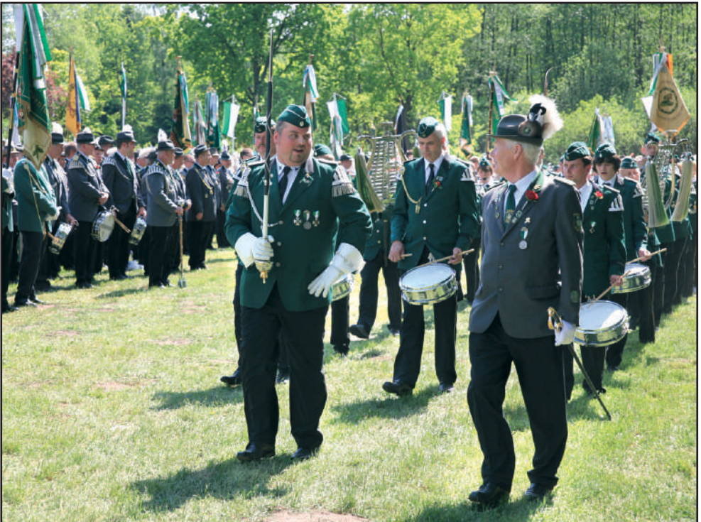
Jubiläumsmarsch: Der Schützenverein Ovelgönne und Umgebung feiert in diesem Jahr sein 100-jähriges Bestehen. Mehr vom großen Festakt ab Seite 26.