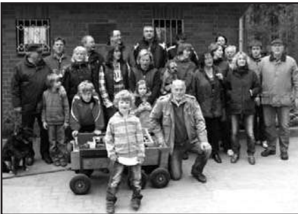
Vereint nach dem gemeinsamen Wettkampf: die Boßelgruppen eins und zwei am Start- und Zielpunkt, der Sportanlage Brune Naht.

Am 15. Mai war es mal wieder soweit: Der TSV Eintracht Immenbeck bedankte sich bei allen Helfern, Förderern und Freunden des Vereins mit der traditionellen Funktionärsfeier. Und fester Bestandteil dieser Veranstaltung ist seit Jahren, dass die Meister des Jahres 2009 geehrt werden. Und das waren jede Menge, wie regelmäßig in den vielen VN-Berichten nachzulesen ist. Auf ein Neues im Jahr 2010: Mit einer neuen Feier und hoffentlich vielen neuen Meistern (siehe auch Fotos übernächste Seite).