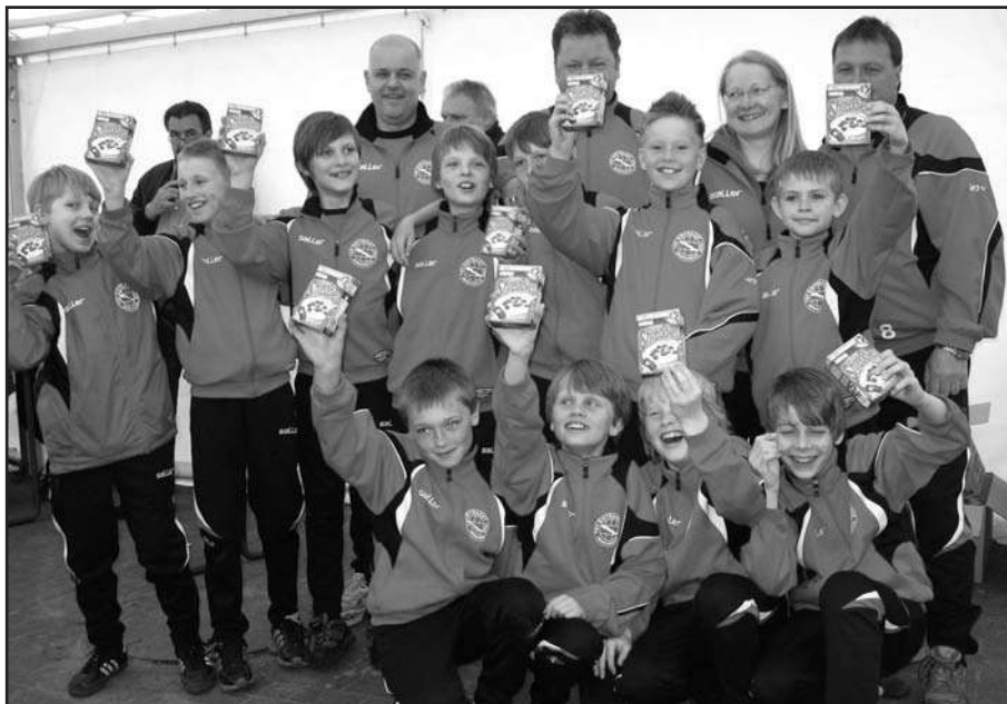
Eine Meistermannschaft stellvertretend für viele im TSV Eintracht Immenbeck. Die Fußball-E-Junioren wurden im Sommer 2009 Kreismeister.