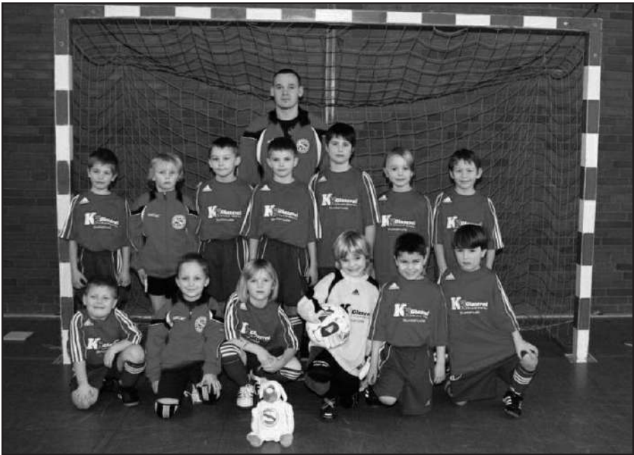
Eine Mannschaft, die zusammen hält und kämpft: die 1. F-Junioren U8 des TSV Eintracht Immenbeck.