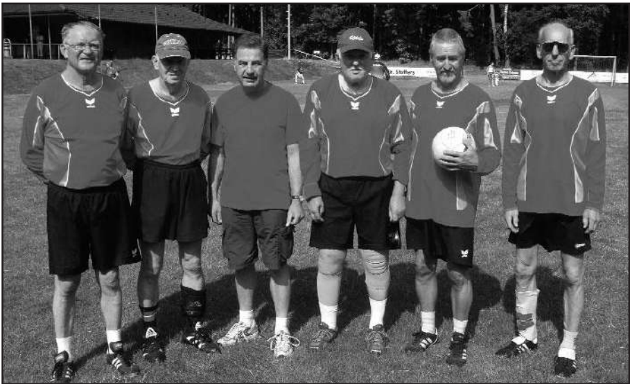
Blieben als Gastgeber leider ohne Satzgewinn bei der Regionalmeisterschaft der Männerklasse 60: die Faustballer des TSV Eintracht Immenbeck.

Bei den Spielern des gastgebenden TSV Eintracht Immenbeck waren die Erwartungen in Kenntnis der Stärken der in höheren Klassen spielenden übrigen Teilnehmer von vornherein begrenzt. Gleichwohl wäre der eine oder andere Satz zu gewinnen gewesen, was aber leider nicht gelang. Auch künftig