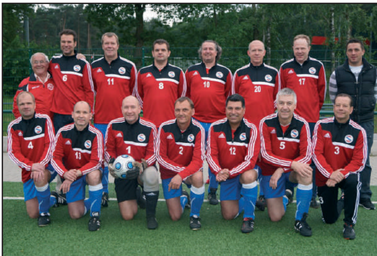
Schickes Outfit: Die 1. Ü40 des TSV mit neuen Aufwärmpullovern von der Firma Meinke Textil- druck.