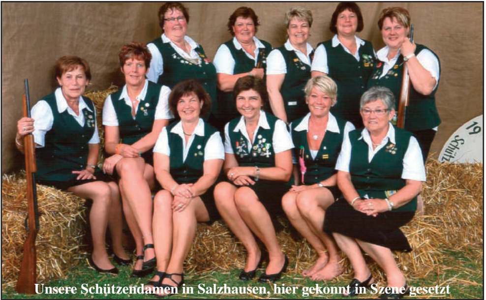
Unsere Schützendamen in Salzhausen, hier gekonnt in Szene gesetzt