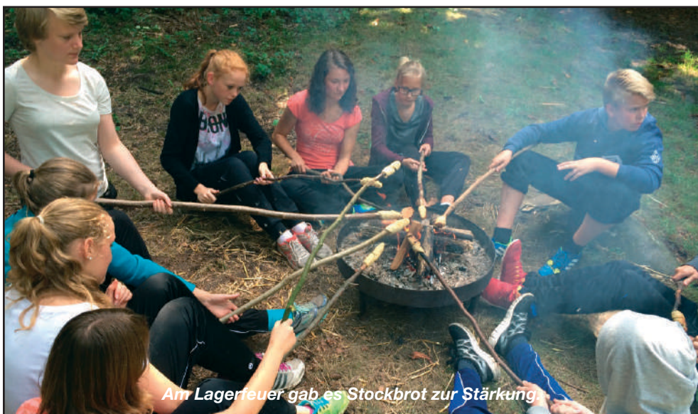
Am Lagerfeuer gab es Stockbrot zur Stärkung.