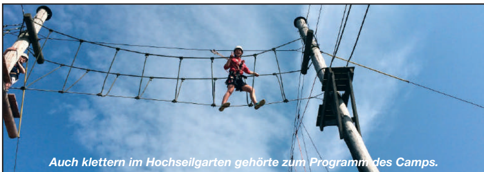
Auch klettern im Hochseilgarten gehörte zum Programm des Camps.

...weitere Bilder vom Fußball- und Freizeitcamp in Bad Malente, an dem die C-Juni- orinnen des TSV in den Sommerferien teilnahmen (siehe Seite 17).