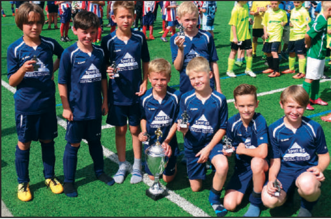
Pokal I: Beim 1. Immenbecker Funino-Masters belegte von der Eintracht die erste Mannschaft der U10-Junioren den dritten Platz.