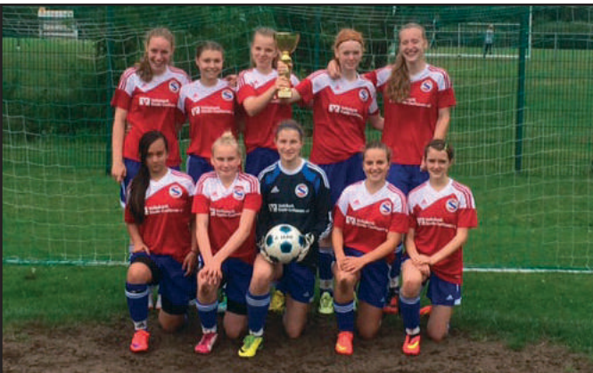
Pokal III: Beim Turnier des TSV Elstorf waren die C-Juniorinnen des TSV nicht zu bezwingen und belegten Platz eins.