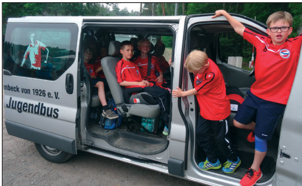
Die erste U10 des TSV Eintracht Immenbeck nahm an einem Turnier in Tönning teil, Übernachtung inklusive.