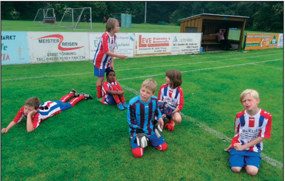
Fertig und kaputt: Nach einem anstrengenden Turnier ging es am späten Nachmittag wieder zurück nach Immenbeck.