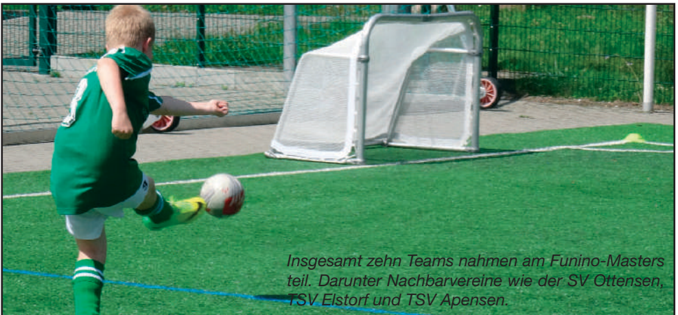
Insgesamt zehn Teams nahmen am Funino-Masters teil. Darunter Nachbarvereine wie der SV Ottensen, TSV Elstorf und TSV Apensen.