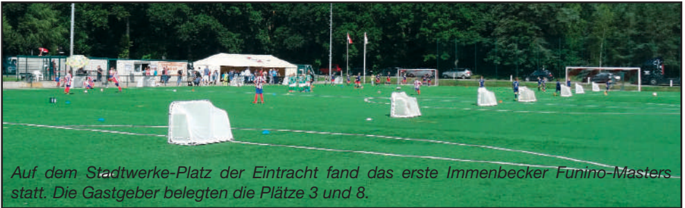
Auf dem Stadtwerke-Platz der Eintracht fand das erste Immenbecker Funino-Masters statt. Die Gastgeber belegten die Plätze 3 und 8.

nen sehr guten dritten Platz beim eigenen Turnier. Das Finale gewann, wie auch schon das Vorrundenspiel, die JSG Ilmenau/Wendisch gegen Blau-Weiß 96 und sicherte sich damit die Immenbecker Funino-Meisterschaft 2015.