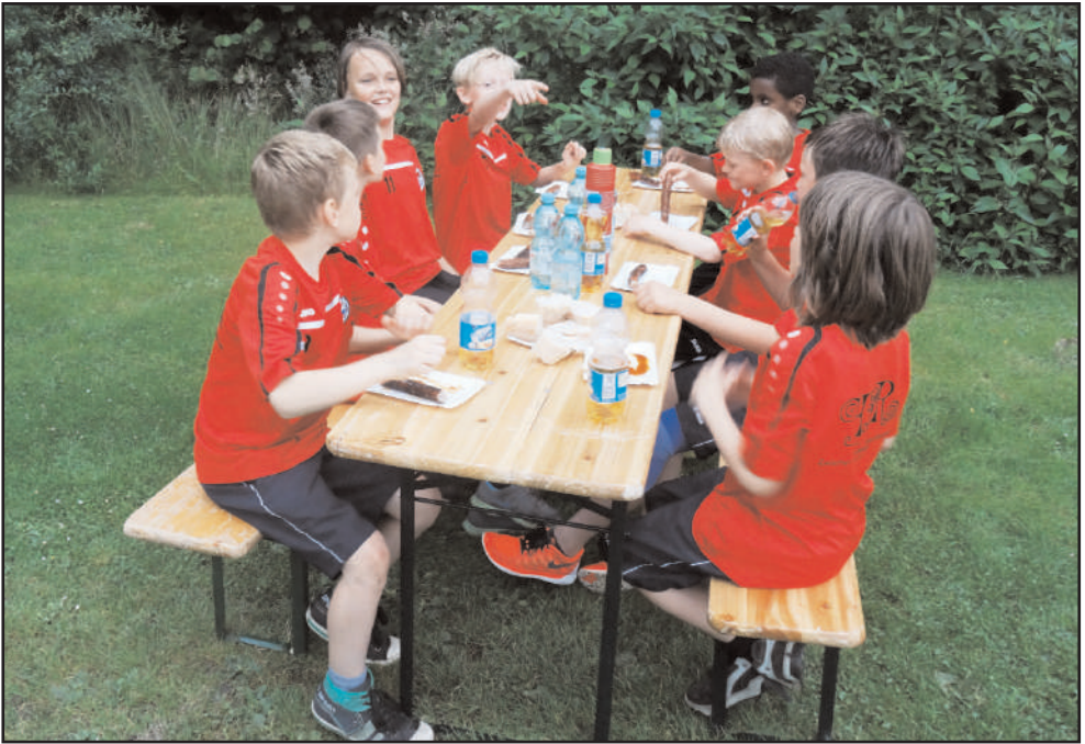
Zur Stärkung eine Bratwurst: Acht Spieler waren in Tönning dabei, dazu drei Betreuer.