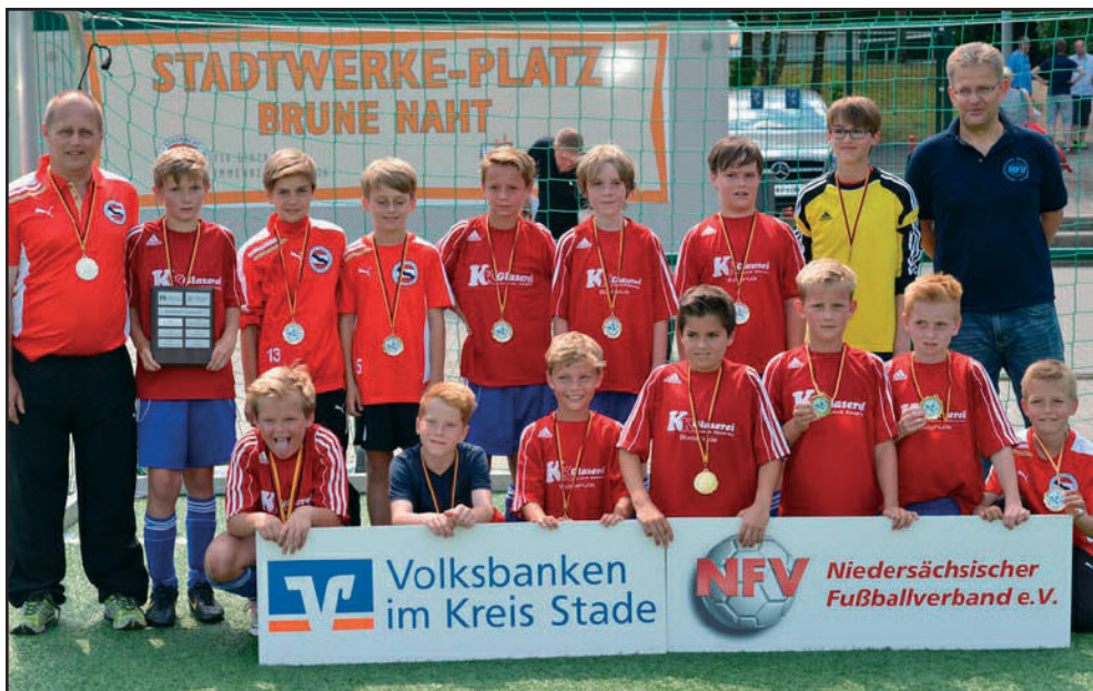
Die erste U11 des TSV sicherte sich überlegen die Kreismeisterschaft.

je drei Schützen stand es 3:3, dann verschossen beide Mannschaften. Schließlich verschossen wir und Stade verwandelte zum 4:3, zog ins Finale ein und gewann dieses dann auch. Wir wünschen dem VfL Stade viel Glück bei der Niedersachsenmeisterschaft in Barsinghausen.