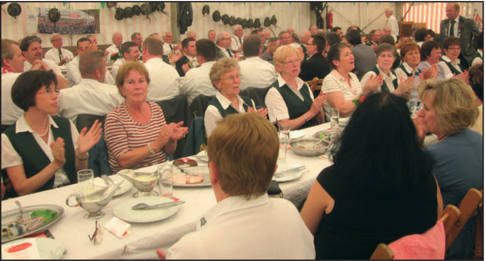
Unsere Damen haben die Gastdamen aus Düsseldorf-Lörick in ihrer Mitte aufgenommen