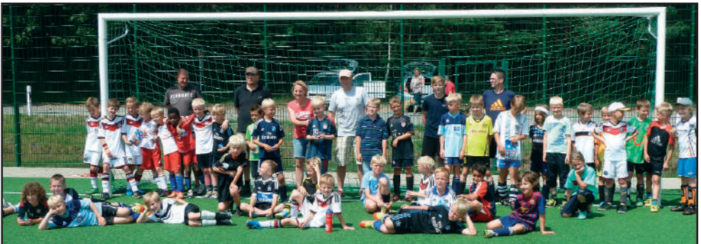
Die Teilnehmer des FairPlayCup: Mit dabei waren die U9-Junioren des TSV Eintracht Immenbeck, ASC Craz-Estebrügge, TSV Elstorf und Ahlerstedt/Ottendorf/Bargstedt.