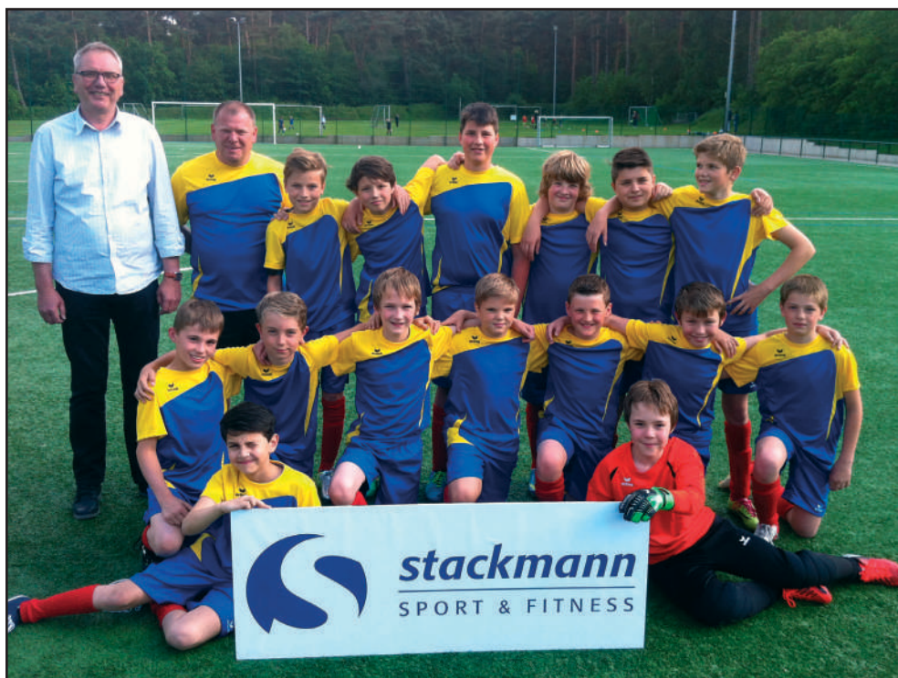
Die Firma Stackmann unterstützte die zweite U12 des TSV bei der Mini-WM.

So kam es am letzten Spieltag zum Showdown gegen die JFV Stade auf der Brune Naht. Stade konnte uns die Meisterschaft noch streitig machen, wenn sie uns mit sechs Toren schlagen würden. Am Ende hieß es nach sehr gutem Spiel 1:1 und die Staffelleisterschaft war perfekt. Der Jubel kannte keine Grenzen, was ich in Form einer tierischen Wasserdusche am eigenen Körper zu spüren bekam. Für den Erfolg gab es für jeden Spieler ein Staffelleister-T-Shirt, worüber sich alle sehr freuten. Anschließend beendeten wir den Tag mit einer kleinen Grillfeier auf dem Sportplatz und hatten dabei sehr viel Spaß. Dafür ebenfalls nochmal ein großes Lob an unsere Eltern, die wieder alles toll organisiert hatten.