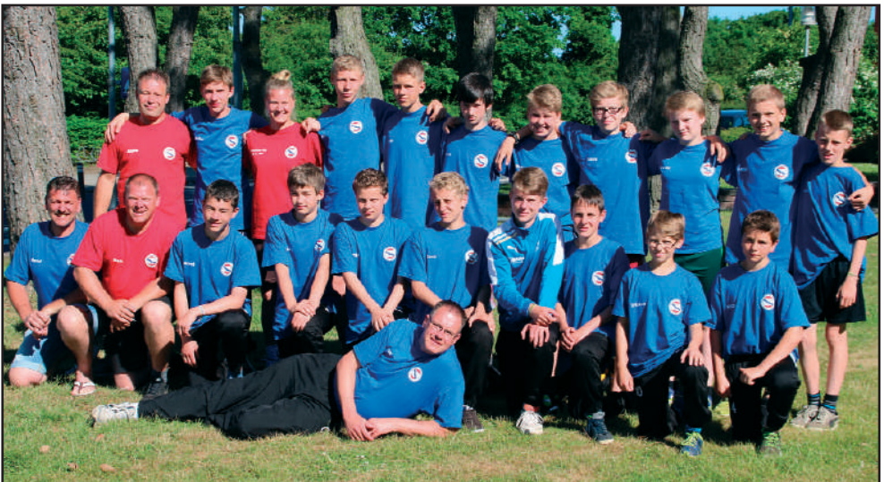
Gute Laune und gutes Wetter beim Ausflug: Über Pfingsten ging es für die U14 des TSV ins dänische Esbjerg.